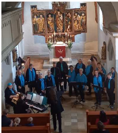
Gospelchor „more than words“