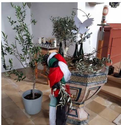
Weltgebetstag 2024 Palästina ... durch das Band des Friedens Ein rundum gelungener Abend! Vielen Dank an das Team, den Chor, die Band und das gemütliche Beisammensein im Gemeindehaus mit landestypischem Essen.