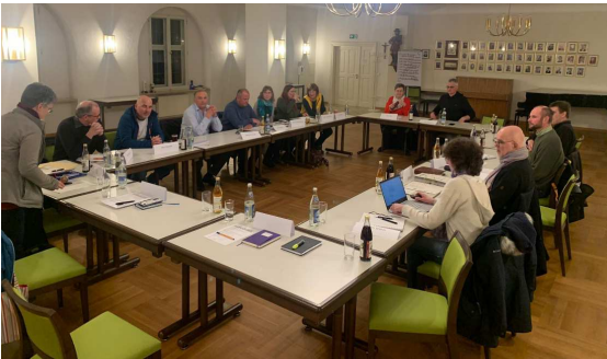
Foto: Gemeinsame Sitzung mit dem Kirchenvorstand Dinkelsbühl am 18. März in Dinkelsbühl