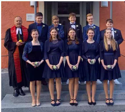
Konfirmation 2024