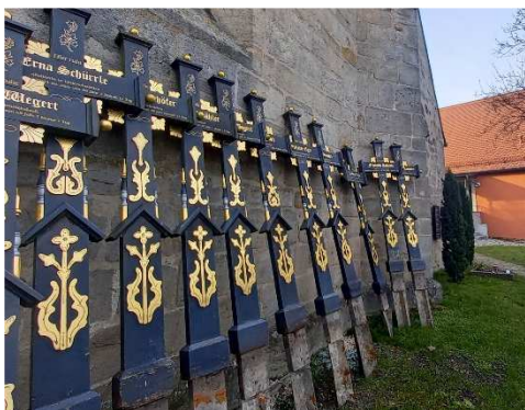
Grabaufösungen an der Ostseite