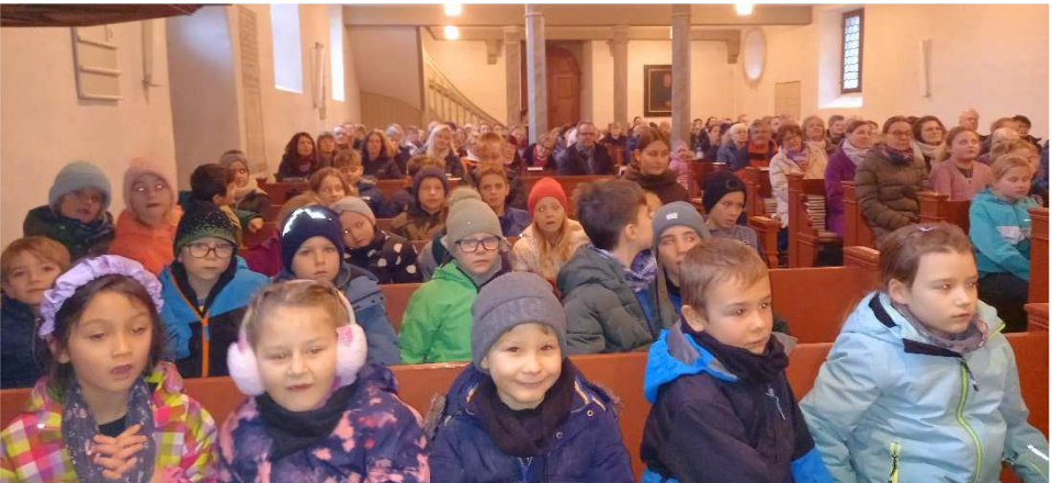
Adventsandacht der Grundschule Segringen