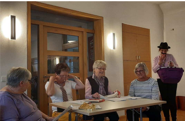
Ein Anspiel des Seniorenkreisteams zum Thema Vorurteile gegen Menschen mit Migrationshintergrund