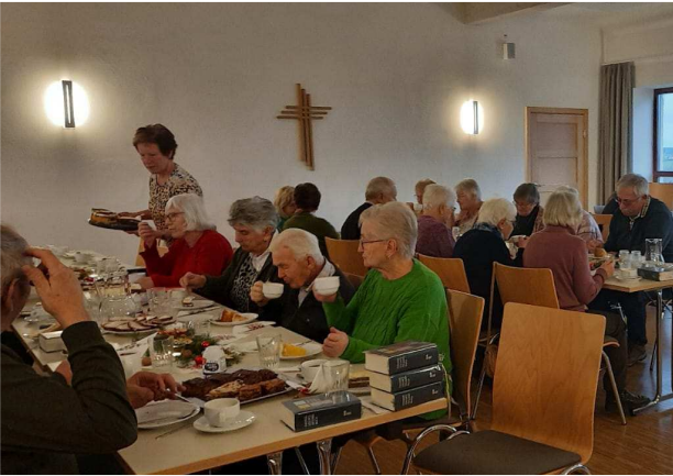
Adventsnachmittag des Seniorenkreises bei Kaffee und Kuchen