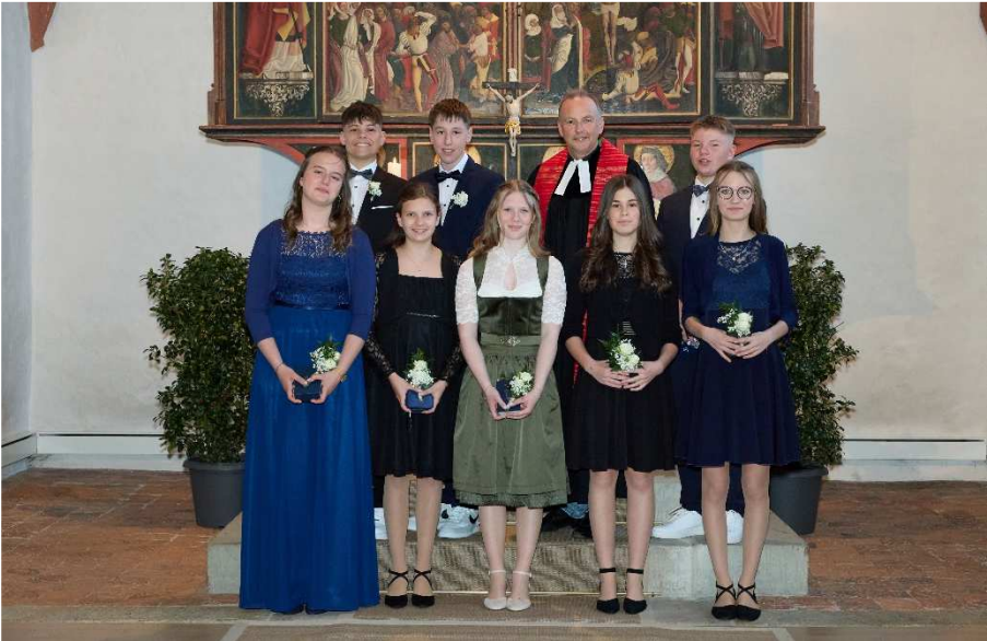
Konfirmanden 2025