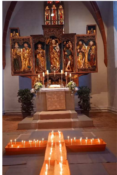
Ostergrab und Altarraum in der Osternacht. (Foto: M. Roth) Titelbild: Renate Wagner