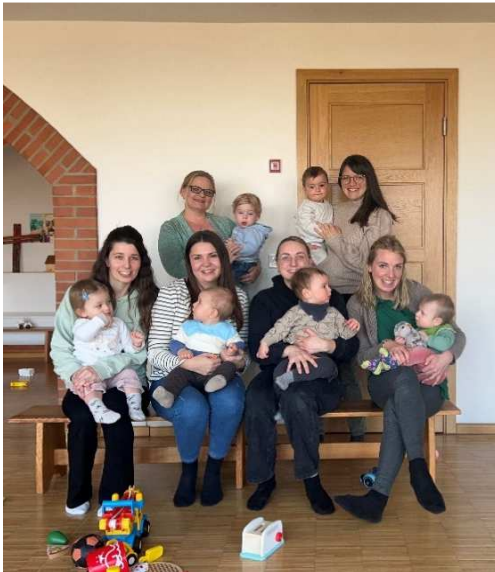
Mutter-Kind-Gruppe bei ihrer Zusammenkunft.